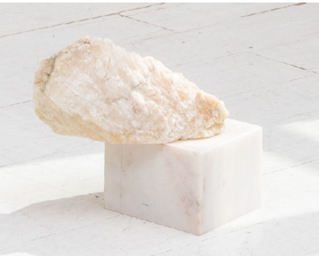
On the edge Marble 2025