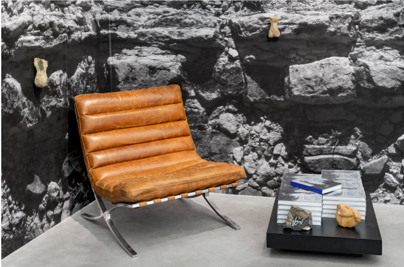
Par dessus l'épaule (Vue d'exposition / Galerie Eric Mouchet) 2023