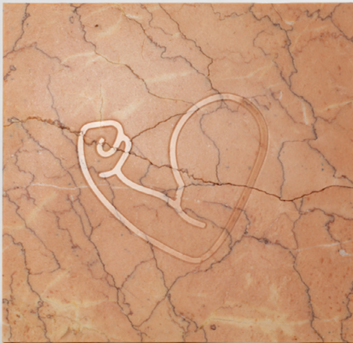
Emojis (muscle) 2023 Gravure à l'acide sur marbre