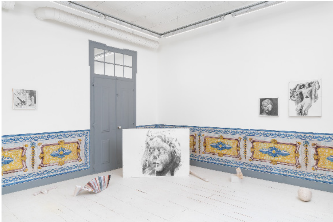
Les Fleurs du Mal La Junqueira Exhibition view 2025