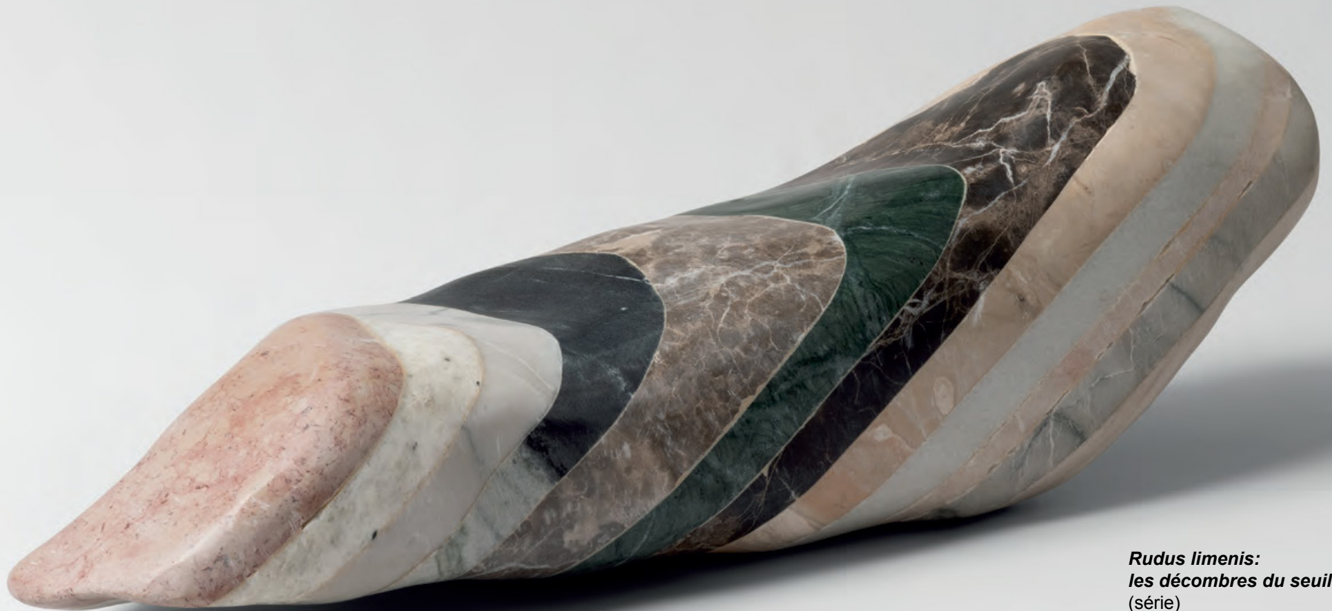
Rudus limenis: les décombres du seuil (série) 2021- 2026 résidus assemblés, retailés et polis

The terms pygmalionism and agalmatophilia describe an attraction to inanimate or non-human objects of a figurative nature, such as statues, dolls, and mannequins. However, no term exists to describe an erotic attraction or fixation specifically directed at stones. This may also be considered a form of paraphilia — that is, a form of sexual arousal that deviates from social norms, regarded as unusual or disruptive.