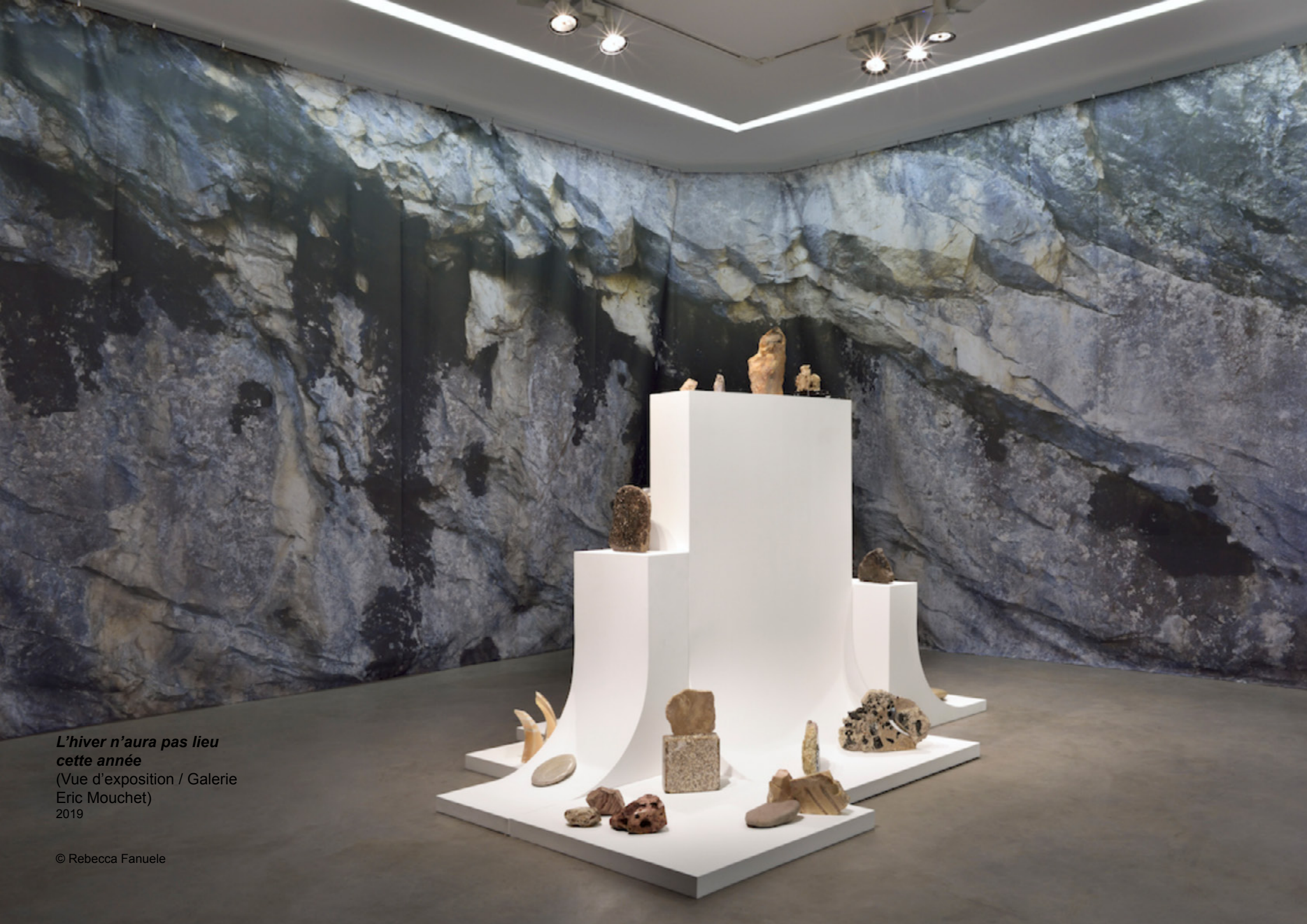
L'hiver n'aura pas lieu cette année (Vue d'exposition / Galerie Eric Mouchet) 2019