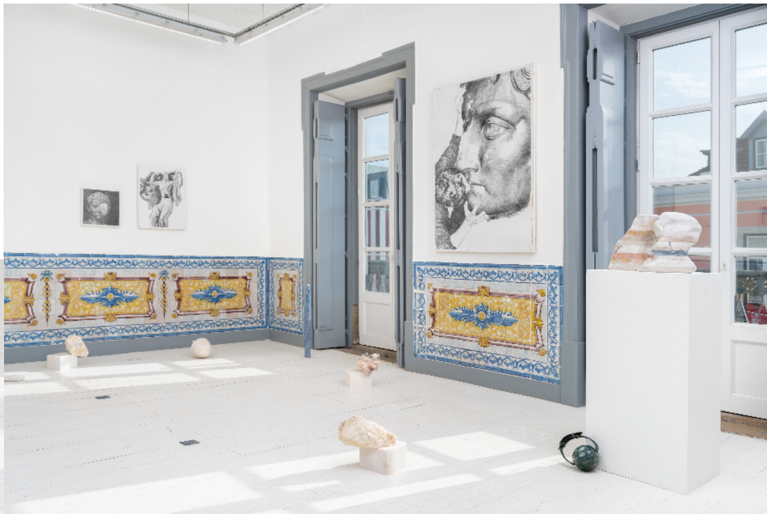
Les Fleurs du Mal La Junqueira Exhibition view 2025