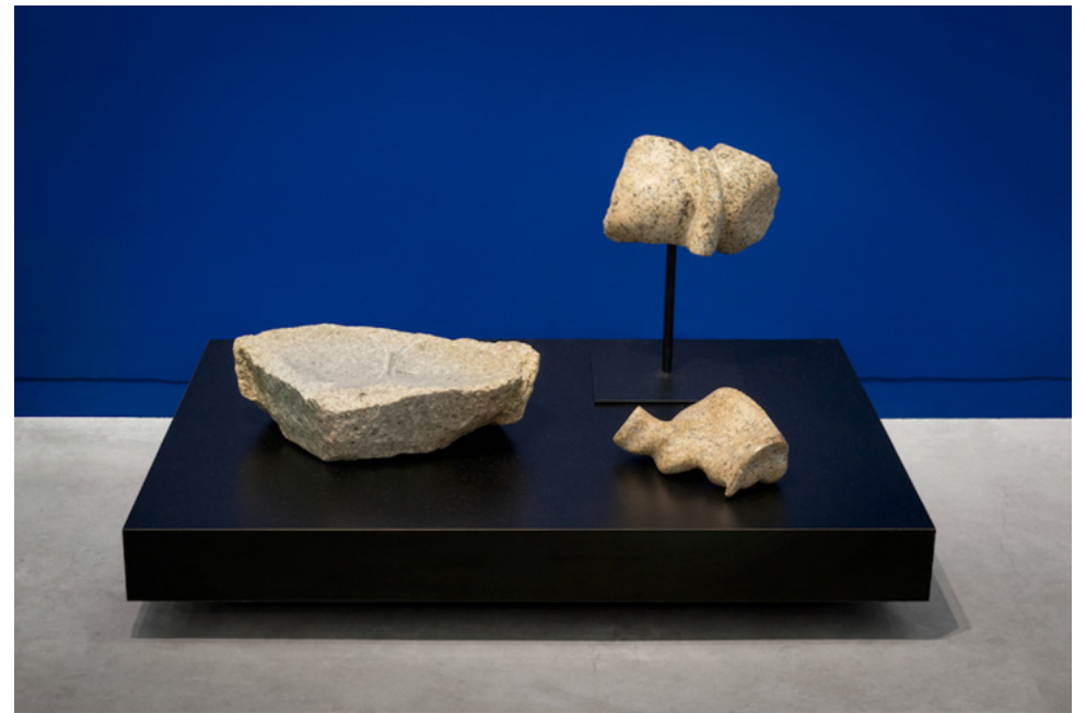
Par dessus l'épaule (Vue d'exposition / Galerie Eric Mouchet) 2023