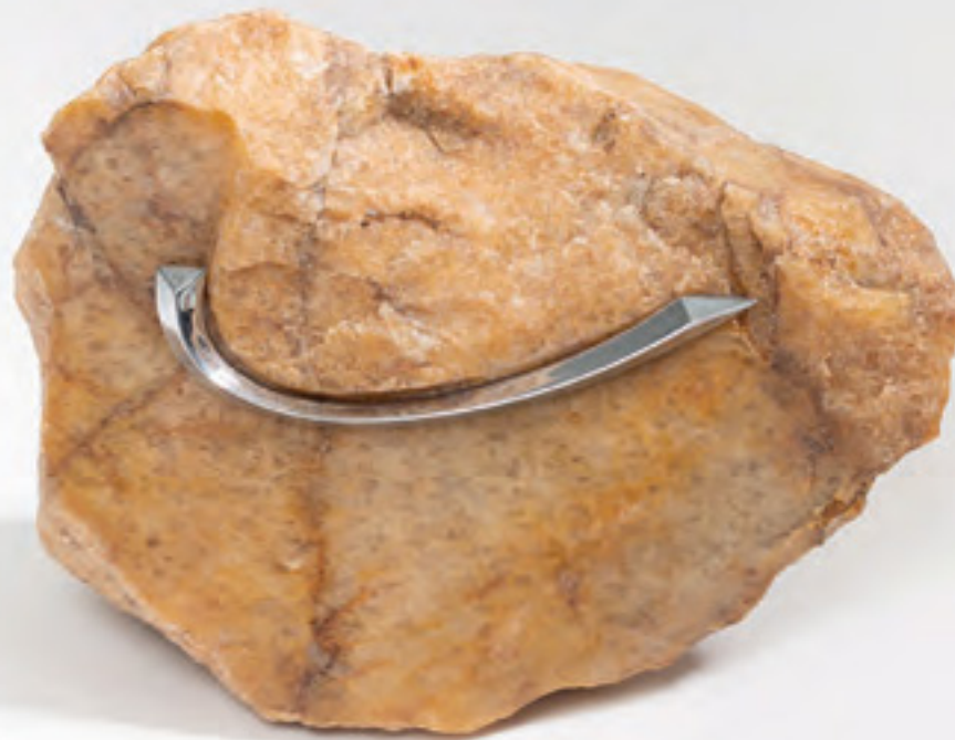
Les pierres tuning (série) 2019 pierre trouvée, taillée et polie, élément de tuning de voiture © Margot Montigny